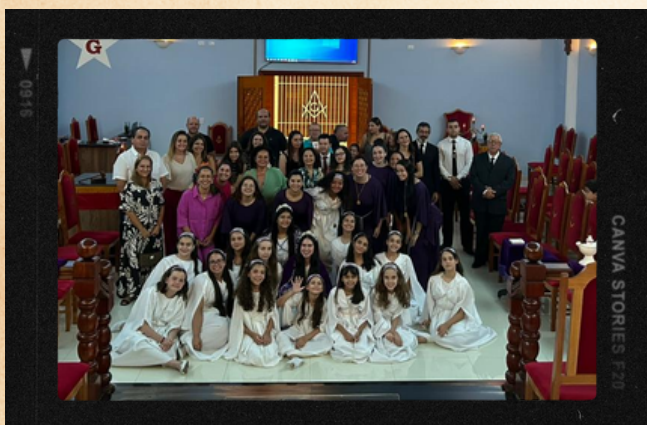
Bethel #11 - Pouso Alegre