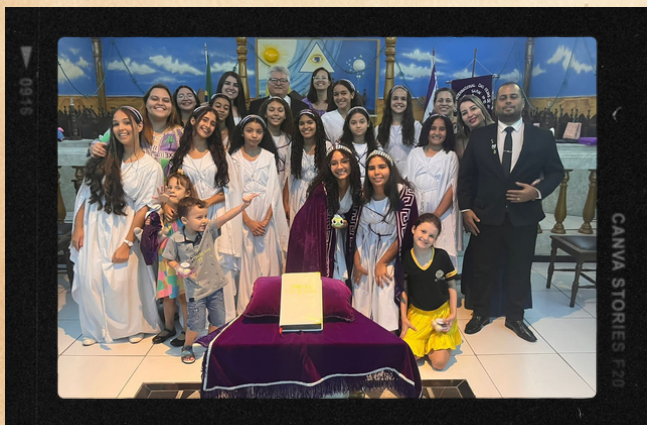
Bethel #10 - Governador Valadares

Em dezembro, nossos Betheis realizaram lindas cerimônias de Instalação das Oficiais que servirão na primeira gestão de 2024. Confira os cliques de alguns Betheis do estado!