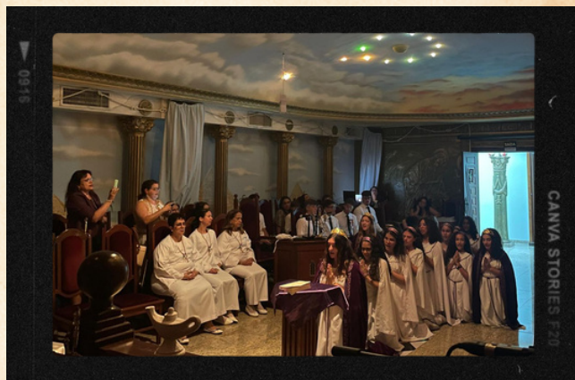
Bethel #56 - Ipatinga