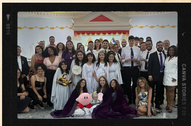
Bethel #01 - Belo Horizonte